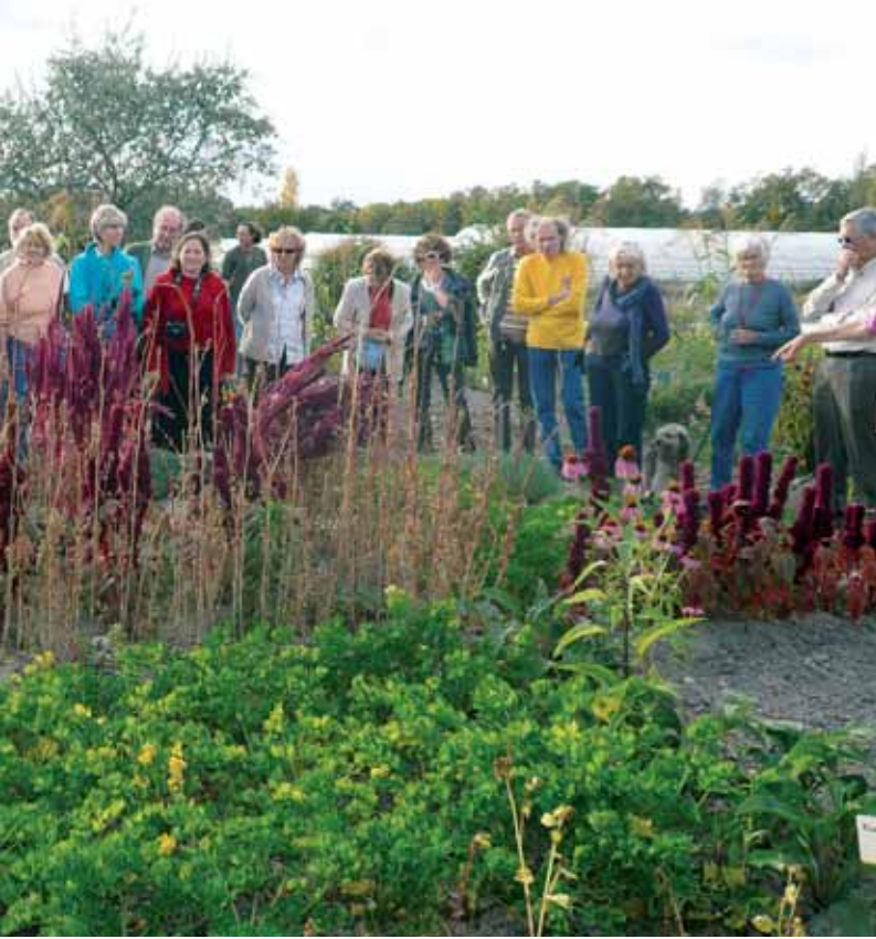
Le Jardin Mandala de la ferme de Sainte-Marthe