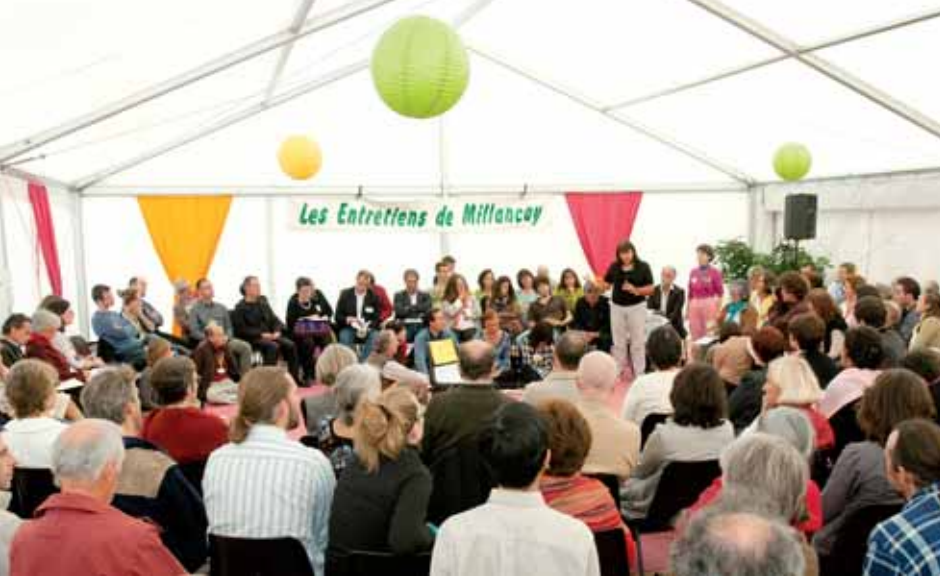
Entretiens 2010 : échanges d'idées durant l'un des forums